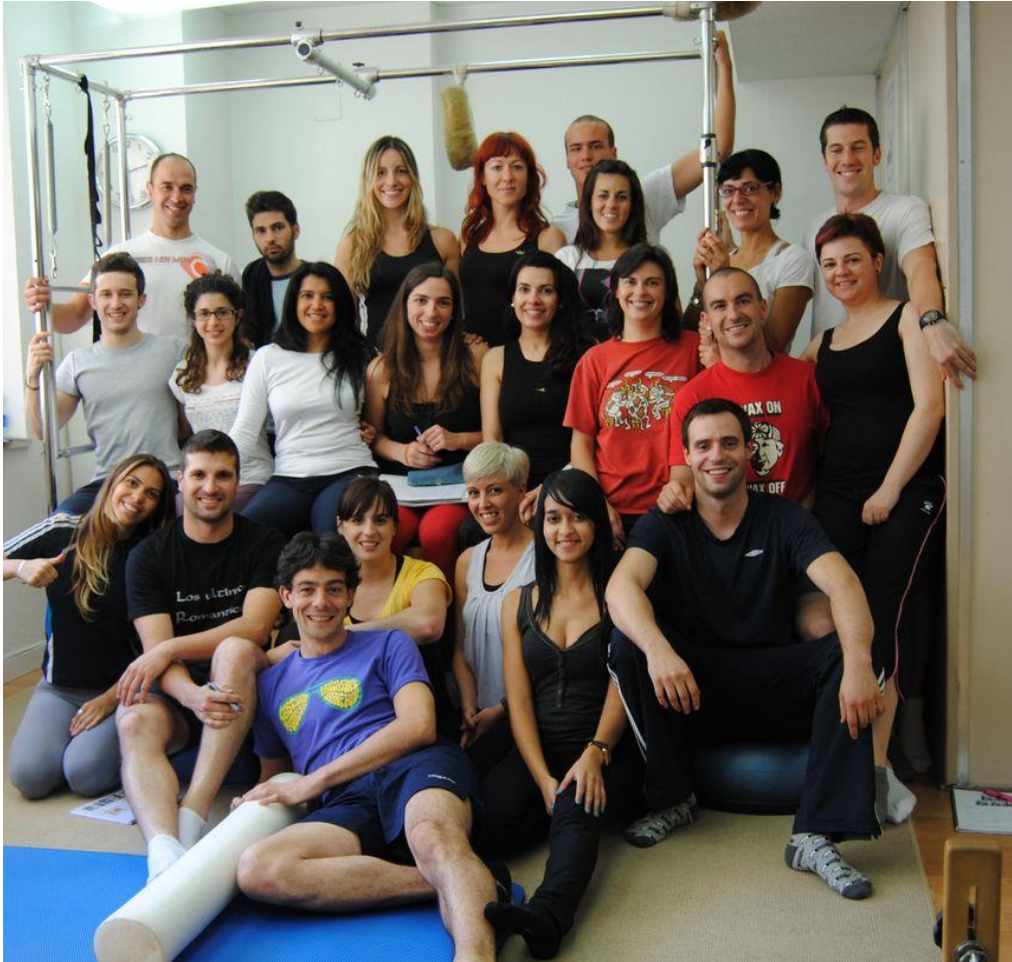
Vª Promoción. 2012