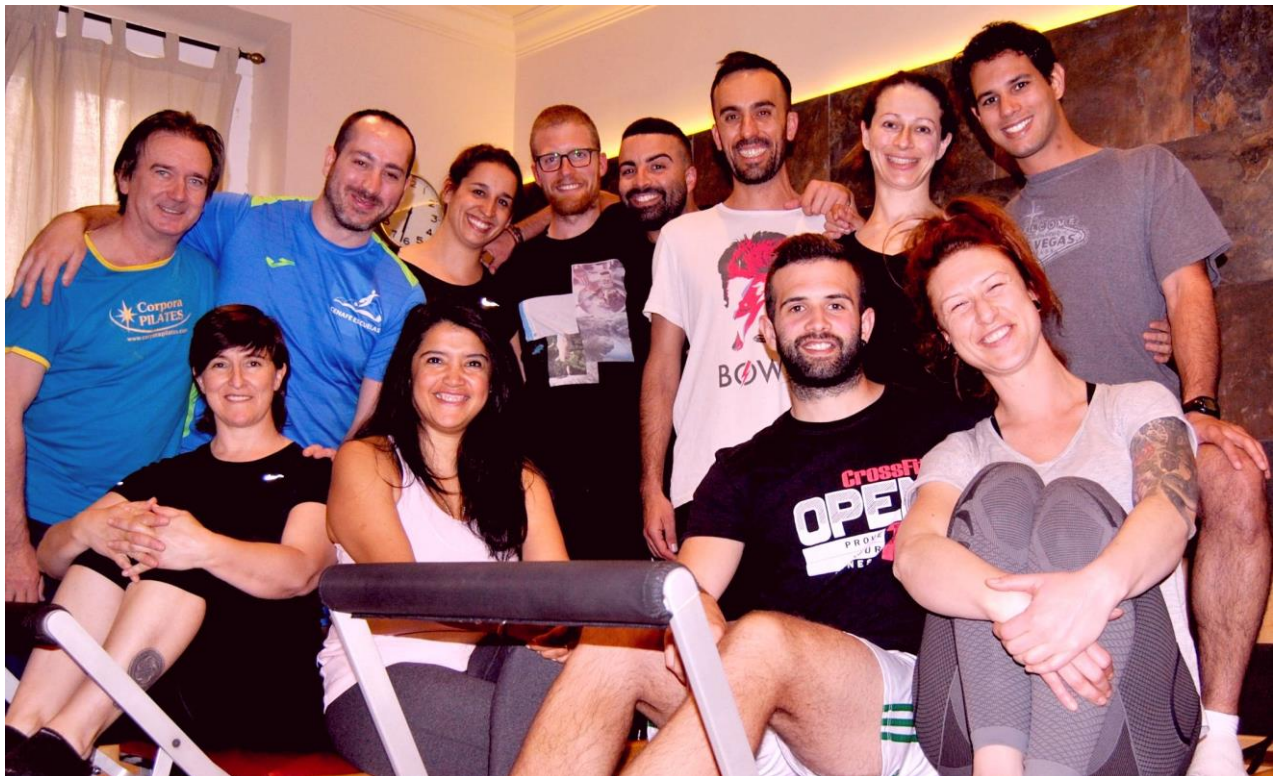
Grupo de Formación y de Experto en Rehabilitación de la X Promoción 2017