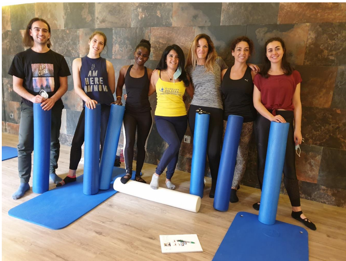
Grupo de Experto Rehabilitación de la XV Promoción 2020-21