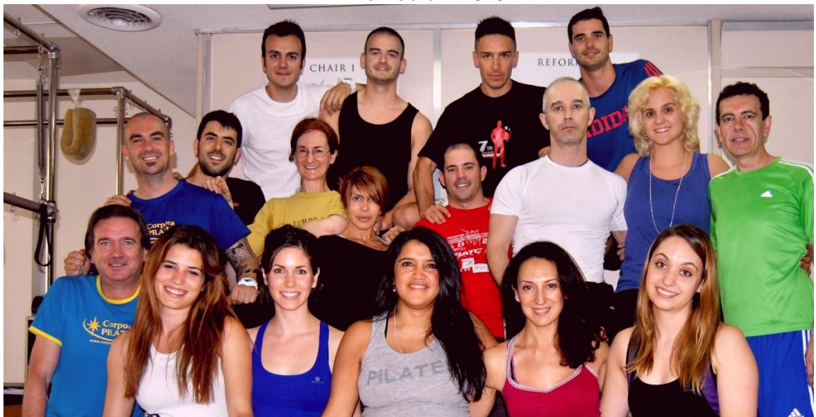
VII Promoción 2014