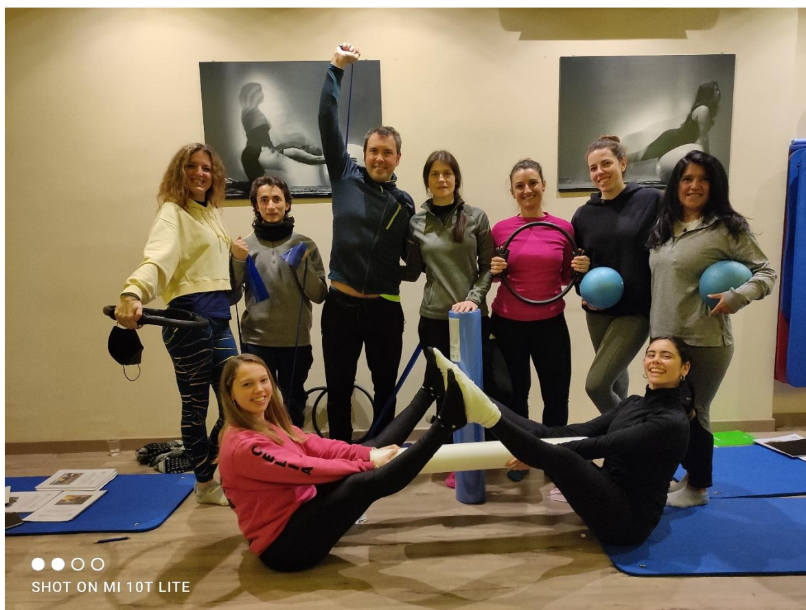
Grupo de la XVII Promoción 2021-22