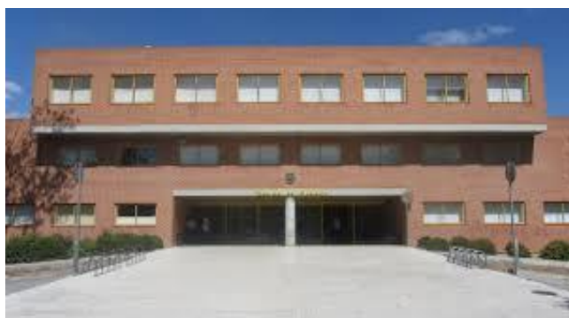
Facultad Medicina (Campus)