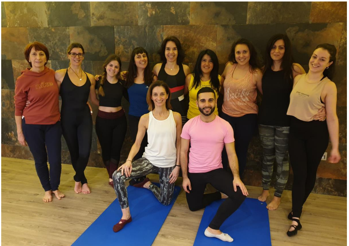
Grupo de Formación de la XIV Promoción 2019-20