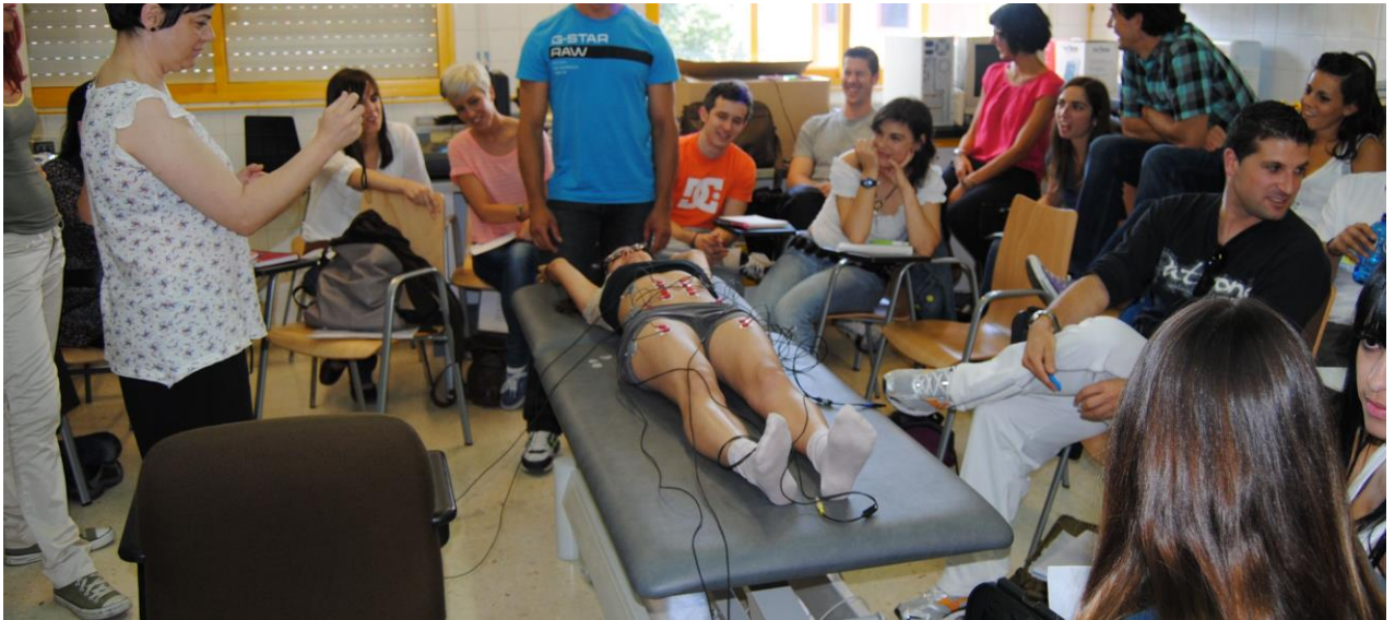
Prácticas de electromiografía de ejercicios Pilates con los alumnos