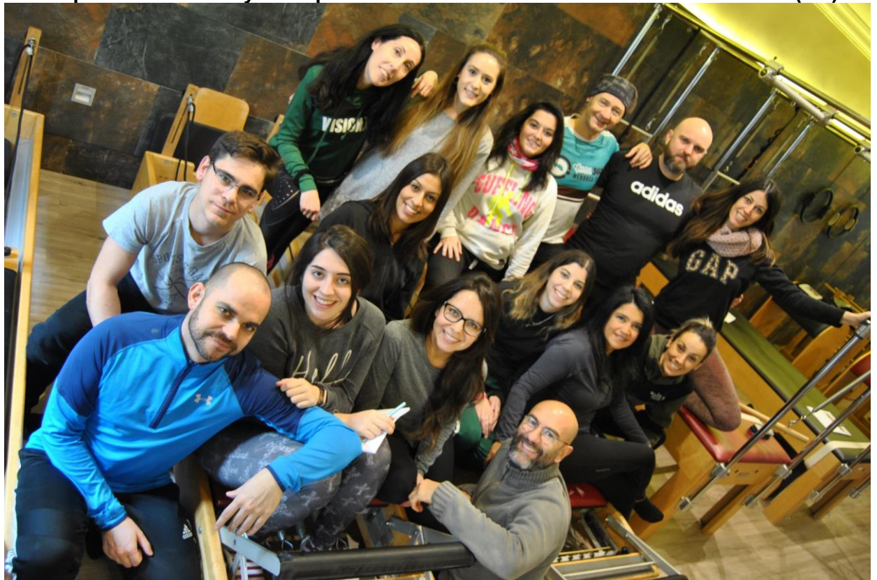
Grupo de Formación y de Experto en Rehabilitación de la XII Promoción 2018 (bis)