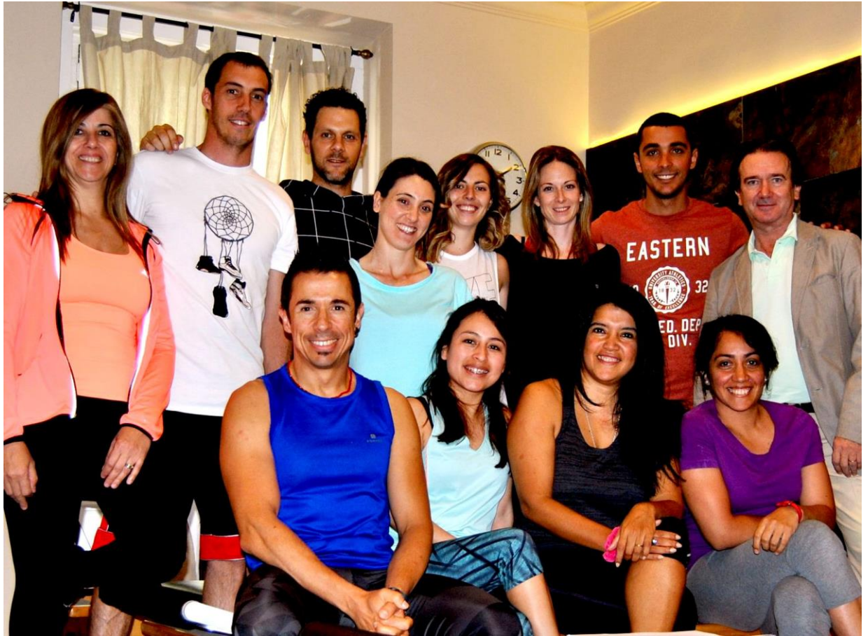
Grupo de Formación y de Experto en Rehabilitación de la IX Promoción 2016