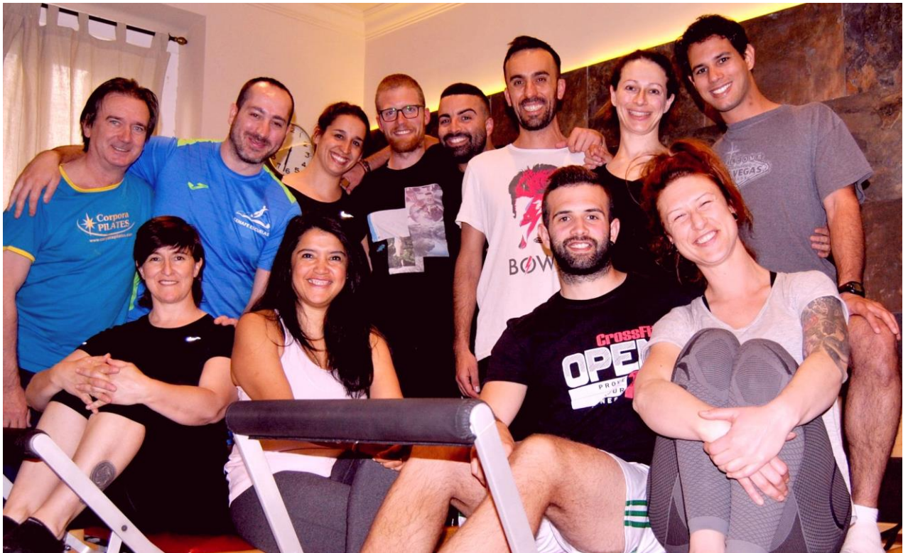
Grupo de Formación y de Experto en Rehabilitación de la X Promoción 2017