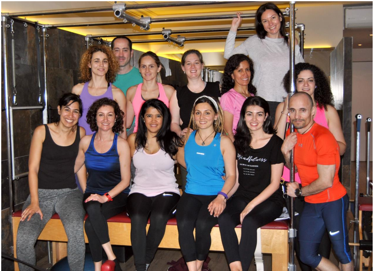
Grupo de Formación y de Experto en Rehabilitación de la XI Promoción 2018